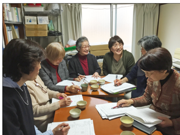
運営委員会の様子。手前とあと7人座っている。